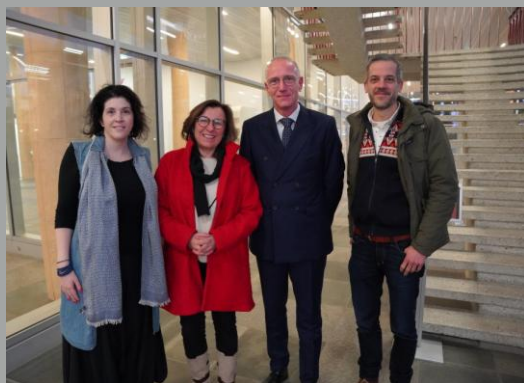
Mme Tilly METZ, députée européenne Explications générales sur les droits humains et le bien-être animal au niveau européen