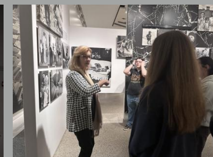
Visite de l'exposition The Family of Man à Clervaux