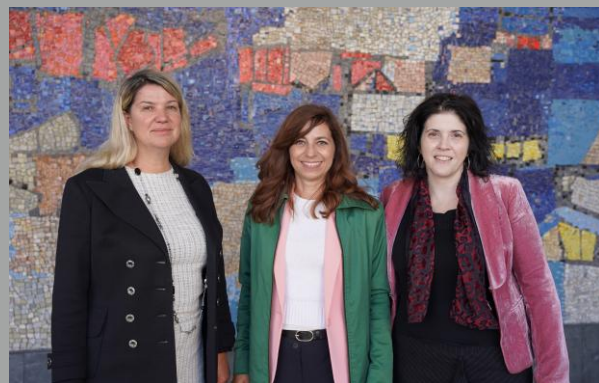
Mme Anne CALTEUX

Sensible à la misère humaine, cette figure emblématique célèbre en France et ailleurs, a soutenu l'idée d'une Europe unifiée en promouvant dans ses écrits la théorie des «États-Unis d'Europe».